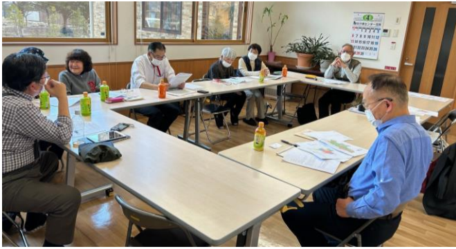
原村関係者が集まり村長懇談対策会議 4/3 ひなたぼっこ

4/3、社保協が16日に行う原村長との懇談を前に、ケアハウスひなたぼっこ（原村）内で、民商や新婦人、年金者組合、村議等の村関係者が集まり対策会議を行いました。同村はかつて老人医療費の無料化や、子ども医療費窓口無料化を先行実施し、